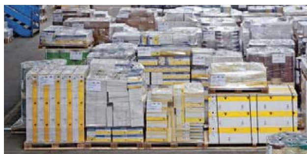
1 Stoccaggio a blocchi