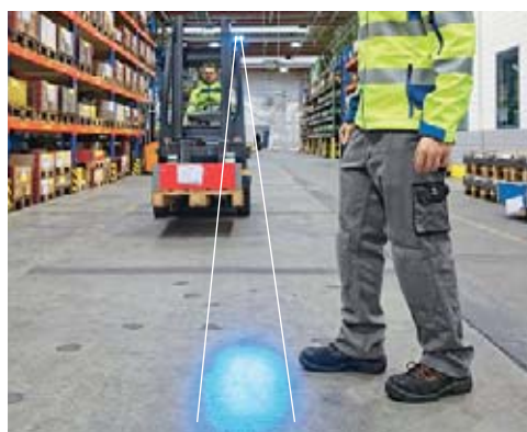
3 Dispositivo d'allarme ottico «punto blu»