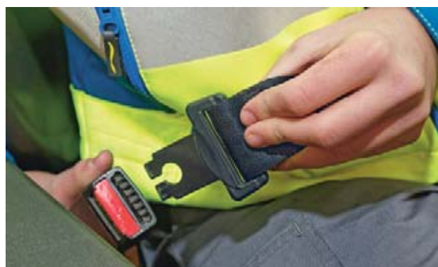
2 Allacciare le cinture di sicurezza.

Sistemi di ritenuta estesi: cinture di sicurezza, staffa di ritenuta, porte della cabina.