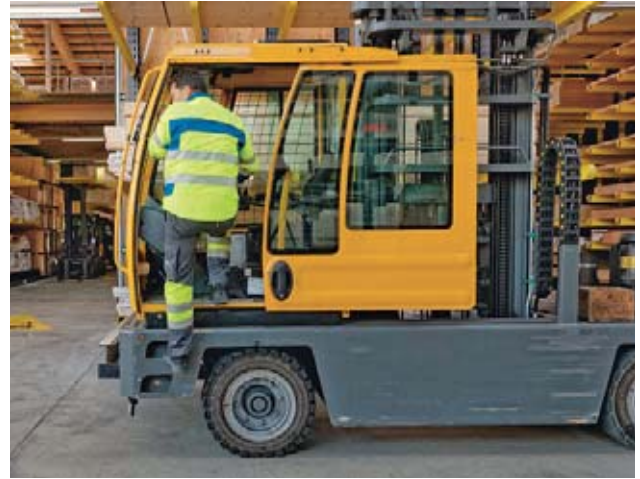
11 Fare attenzione durante la discesa.