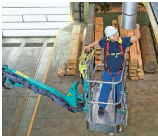
1 Piattaforma di lavoro elevabile per la sostituzione di lampade in altezza