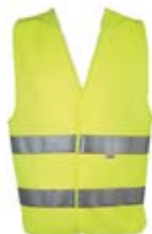
2 Gilet ad alta visibilità