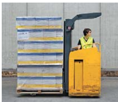
1 Messa in sicurezza del carico con fascette