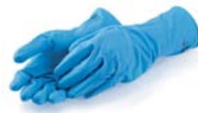
4 Guanti di protezione resistenti agli acidi