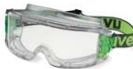
3 Occhiali di protezione a mascherina