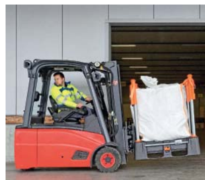
3 Trasporto di un big bag su pallet speciale