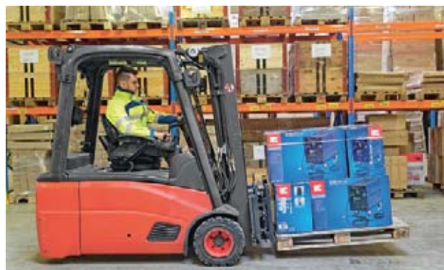
1 Manovrare il carrello elevatore dal posto di guida.