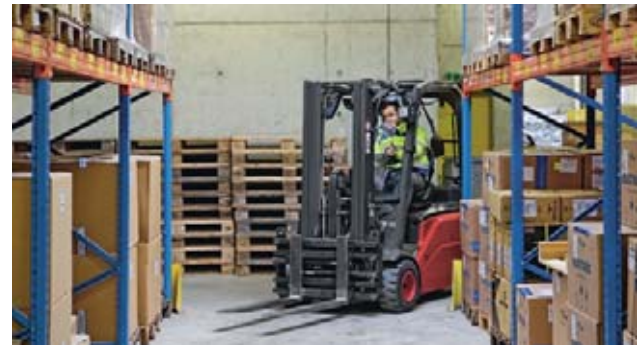
6 Adagio in curva!