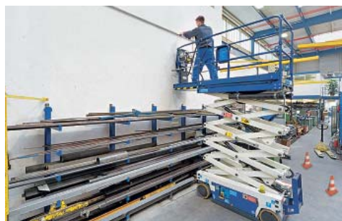
2 Piattaforma di lavoro elevabile per lavori di installazione e pulizia in altezza