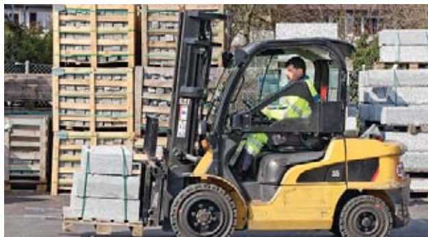
4 Posizionare il carico vicino al dorso forche.