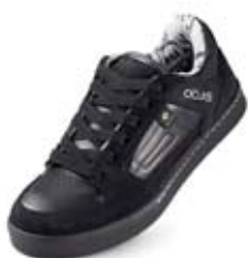
1 Calzatura di sicurezza con puntale di protezione

Per le ditte fornitrici di DPI visitare il sito www.sapros.ch .