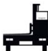
Carrello elevatore a forche laterali