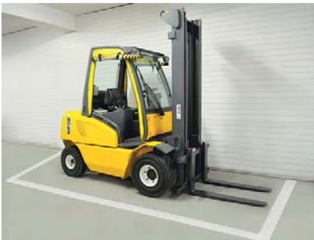
10 Parcheggiare nello spazio appositamente previsto.