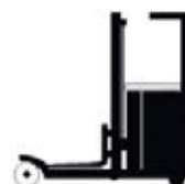
Carrello elevatore con montante retrattile