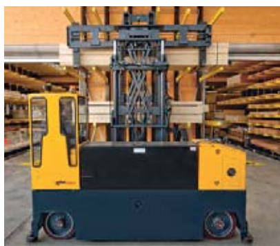
2 Carrello elevatore a forche laterali per il trasporto di merci lunghe