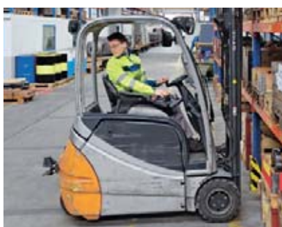
2 Guardare indietro.