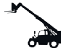
Carrello elevatore telescopico