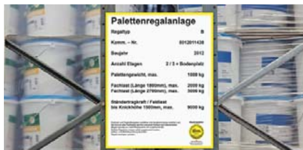
2 Stoccaggio a scaffalatura, attenzione alla portata