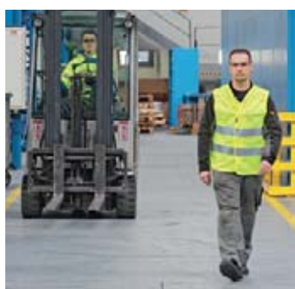
1 Sorpassare i pedoni a una distanza adeguata.