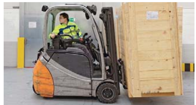
8 Se la visuale è impedita, innestare la retromarcia guardando indietro.