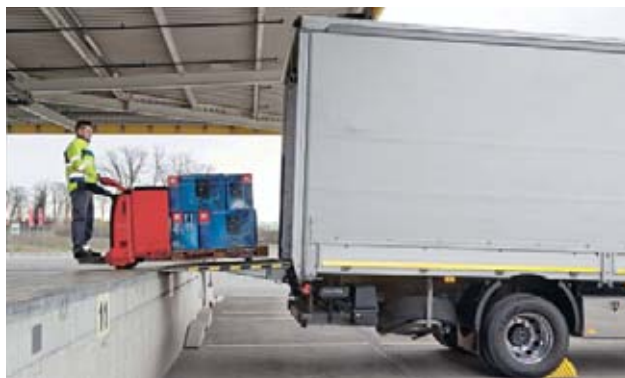
5 Mettere in sicurezza il veicolo per evitare spostamenti accidentali (cuneo).