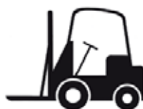
Carrello elevatore con forche a sbalzo