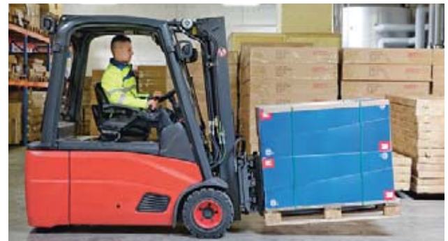
7 Abbassare il carico durante la marcia.