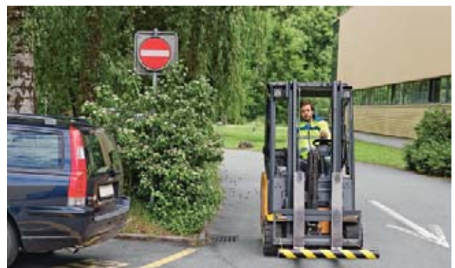
12 Forche munite di barre di protezione.