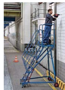
3 Pedana di lavoro per lavori in altezza