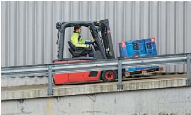
9 Trasportare il carico nel senso della salita.